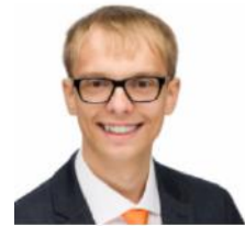
Auszubildender der acmeo GmbH