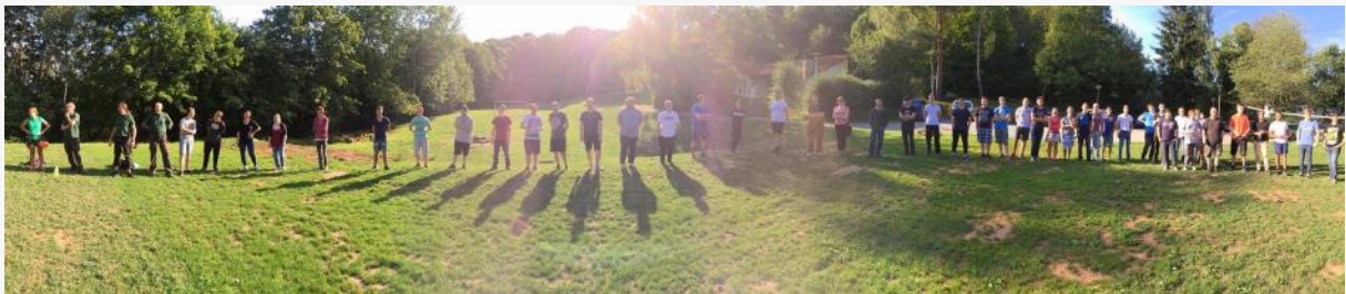
Teilnehmer des Azubi Boot Camps bei der Einweisung vor dem Kletter-Event am Samstag Abend

für einen erfolgreichen Einstieg junger Menschen ins Berufsleben