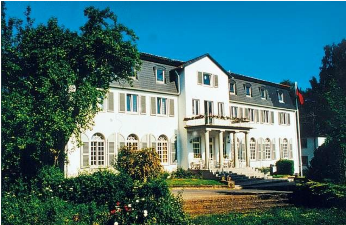
Bildungsstätte und Jugendherberge „Der Heiligenhof“ Alte Euerdorfer Str. 1, 97688 Bad Kissingen